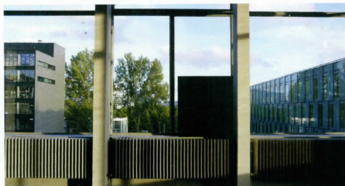
aaaaaaaaaaaaaaaaaaaaaaaaaaaaaaaaaaaaaaaaaaaaaaaaaaaaaaaaaaaaaaaaaaaaaaaaaaaaaa, 2016, performatieve installatie, afmetingen variabel

Yasmijn Jarram is kunstkriticus en curator